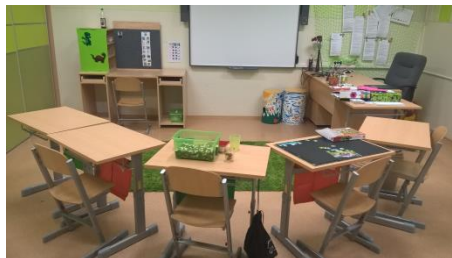
Všechny třídy umožňují střídání pracovního rytmu se začleněním chvilky odpočinku nebo hry