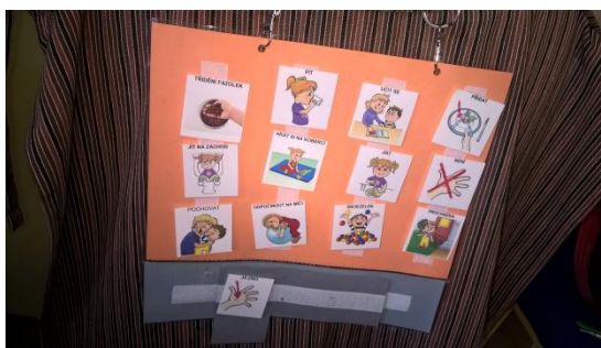
Využití metody VOKS