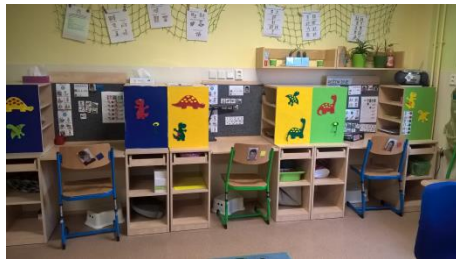
Prostředí třídy s možností využití relaxačního koutku