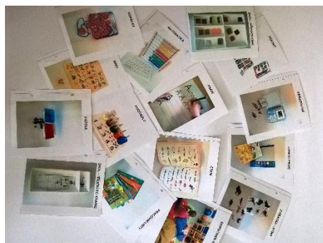
Strukturované učení a denní režimy