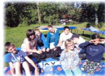
Obrázek 2: Žáci na canisterapii