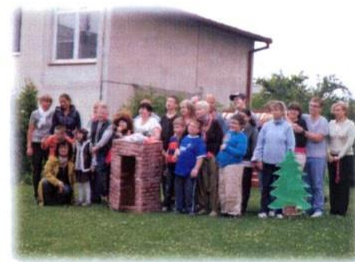
Obrázek 3: Akce workshop Strakonice; Zdroj: vlastní foto