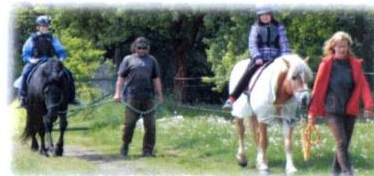
Obrázek 4: Žáci na hipoterapii; Zdroj: vlastní foto